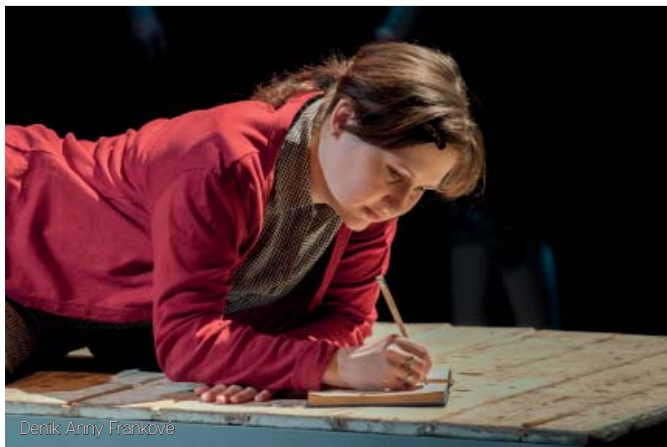
Deník Anny Frankové